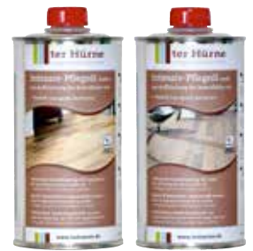
Intensiv-Pflegeöl farblos/weiß Artikel-Nr. 1101060086/ 1101060087

Hinweis: Bei außergewöhnlicher Abnutzung sollte die Oberfläche vorzugsweise durch einen qualifizierten Parkettverleger erneuert werden.