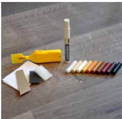
Hartwachs-Reparaturset Artikel-Nr. 1101060150

Für die Reparatur von kleinen Schäden in Bodenoberflächen (z.B. Kratzer, Druckstellen, kleine Löcher).